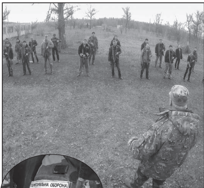
Відтепер фермери, що опанували непросту аграрну науку, навчаються і на полі бою.